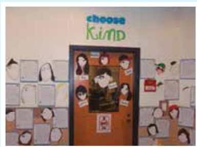
Osnovna škola Paris u Maineu Izaberi dobrotu prije nego što udeš!