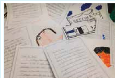
Pisma autorici R.J. Palacio

Učenici škole Greenwich Academy u Greenwichu, Connecticutu, napravili su „Jamu čuda“ kako bi pomogli učenicima pričati o prijateljstvu i dobroti!