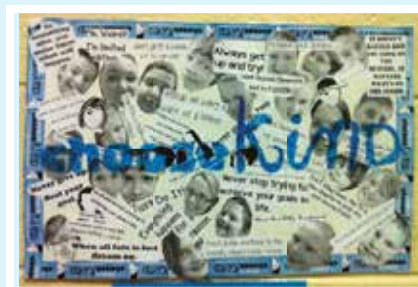
Javna škola Rose Eaton Oglasna ploča s mudrim izrekama